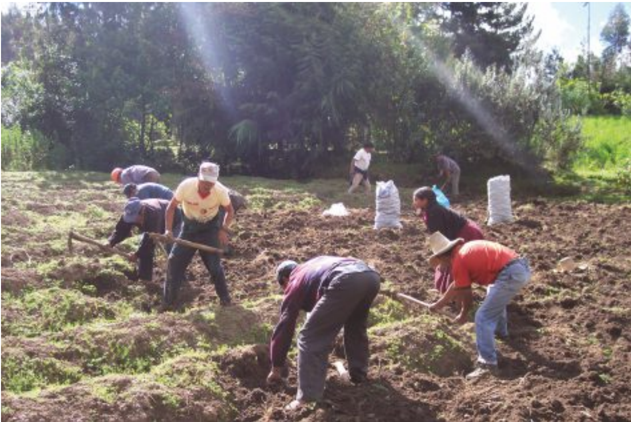
Beneficiarios del Proyecto "Papa Nativa" en plena cosecha comunal.

Para la Alianza es de vital importancia tener la claridad y el marco conceptual del trabajo que viene realizando para compartir y socializar las orientaciones matrices que coadyuven al cumplimiento de la misión que se ha propuesto, así como para potenciar la sinergia entre sus integrantes y efectivizar el impacto de las actividades que viene desarrollando.