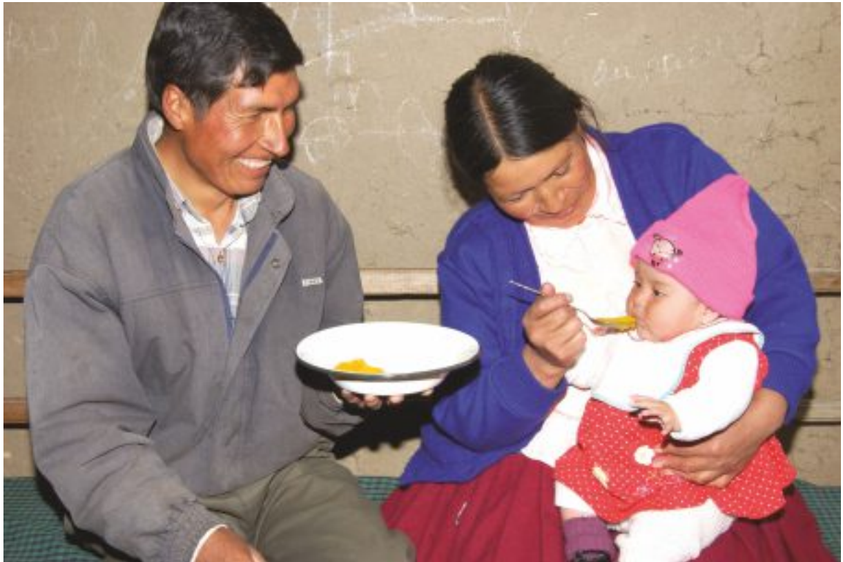
Familia en prácticas de nutrición – PREDECI.

El Desarrollo Rural Integral Territorial - DRIT - permite a las personas, familias y colectivos del territorio fortalecer sus capacidades y mejorar sus condiciones de vida de manera sostenible.