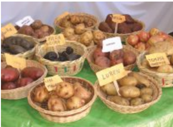
Diversidad de papa nativa.

Hace énfasis en la “revolución del supermercado”, la cual se traduce en demandas crecientes de productos de valor más alto. También aconseja la promoción de la economía rural no agrícola mejorando destrezas para acceso a nuevos puestos de trabajo en sectores de industria y servicios.