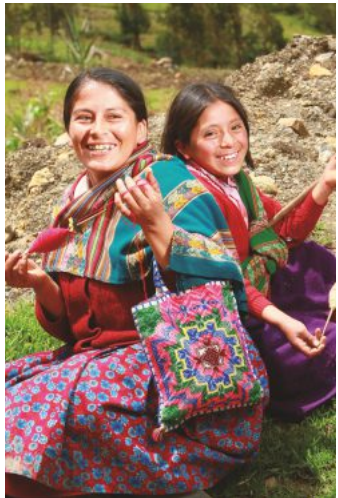
Familia de Faro Bajo – Sorochuco.

El Desarrollo Rural Integral Territorial - DRIT - permite a las personas, familias y colectivos del territorio fortalecer sus capacidades y mejorar sus condiciones de vida de manera sostenible.