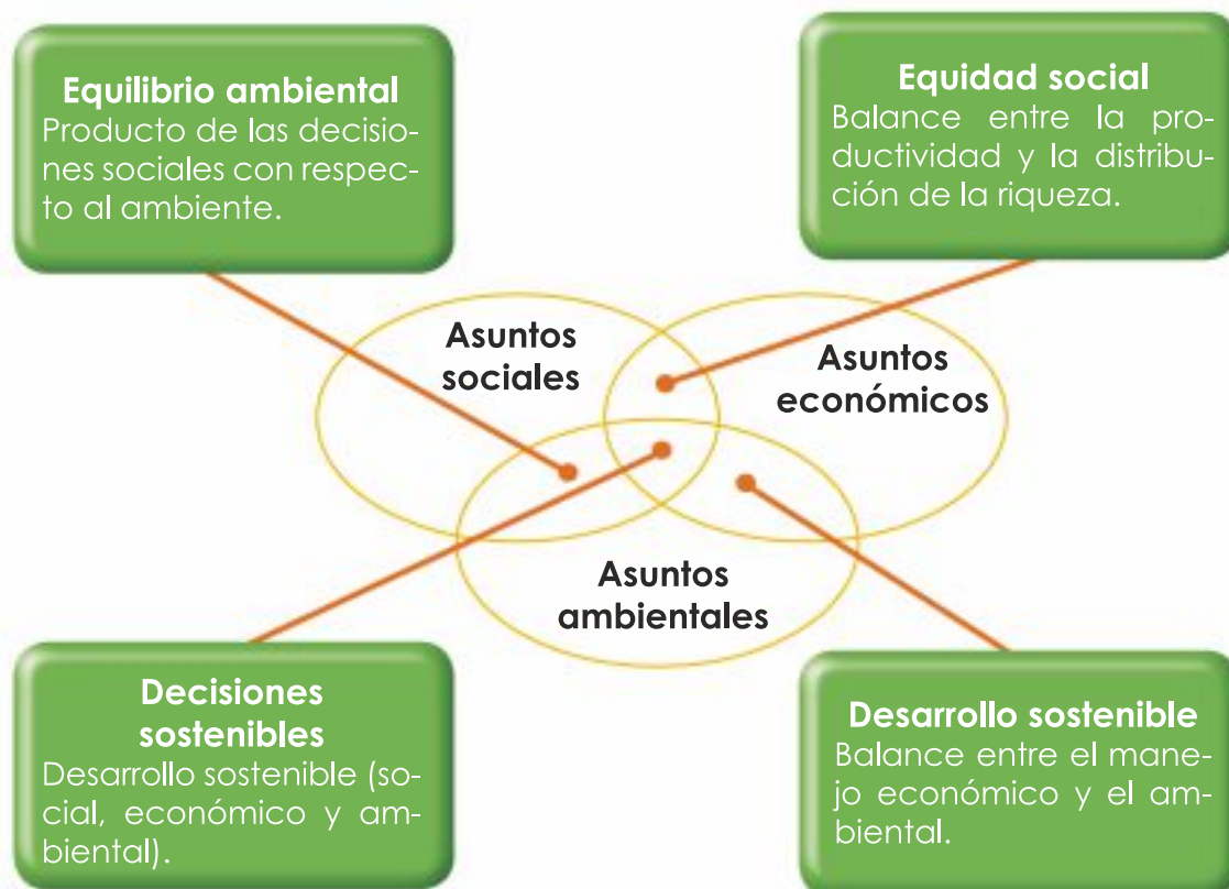
GRÁFICO 1 Desarrollo Sostenible