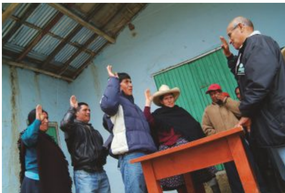
Juramentación del Comité de Desarrollo Comunal de Santa Rosa de Huasmín.

Los territorios también se demarcan cada vez de nuevas maneras, y en consecuencia: “La comunidad geográfica basada en el territorio ya no se considera el mejor punto de acceso para la planificación del desarrollo” 22 , los territorios mutan y se recomponen en nuevos o se subdividen en nuevas dinámicas de ordenamiento.