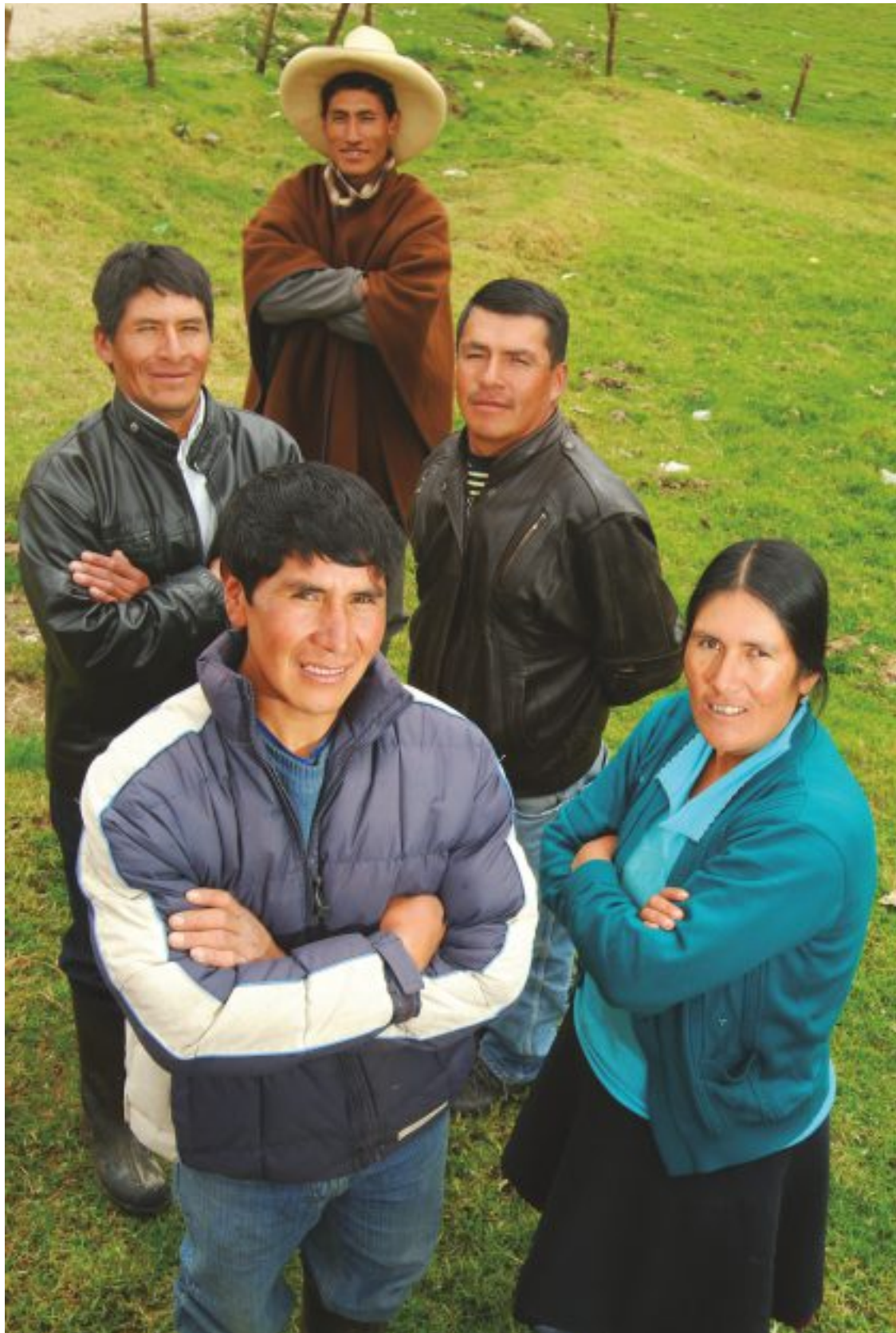
Comité de Desarrollo Comunal Santa Rosa de Huasmín.