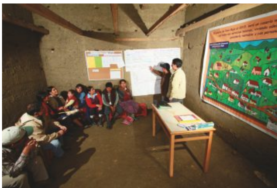
Centro de Información del Comité de Desarrollo Comunal de Faro Bajo – Sorochuco.

El fortalecimiento de las organizaciones de base está destinado a mejorar la capacidad de ellas para participar conjuntamente con otras organizaciones de base y el Estado en la gestión social pública y en la vida democrática.