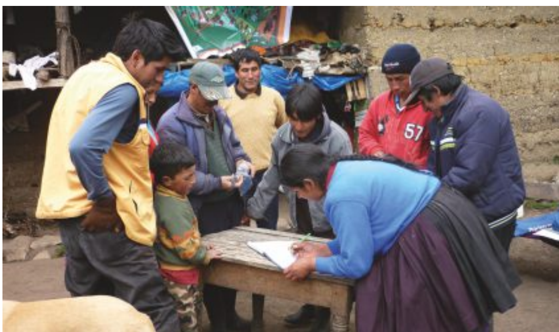
Elaboración del Plan Operativo Anual de los CODECOS .