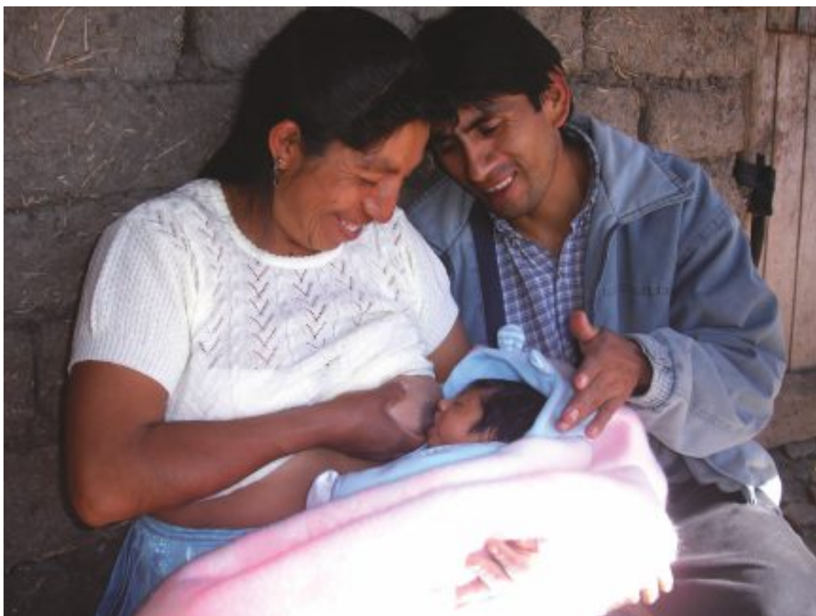
Alianza por la nutrición en Cajamarca - PREDECI.

El desarrollo es mucho más que crecimiento económico e incremento de ingresos. Desarrollo, es crecimiento de las personas, de las sociedades y de las instituciones para garantizar las mejores condiciones de vida a ciudadanos y ciudadanas.