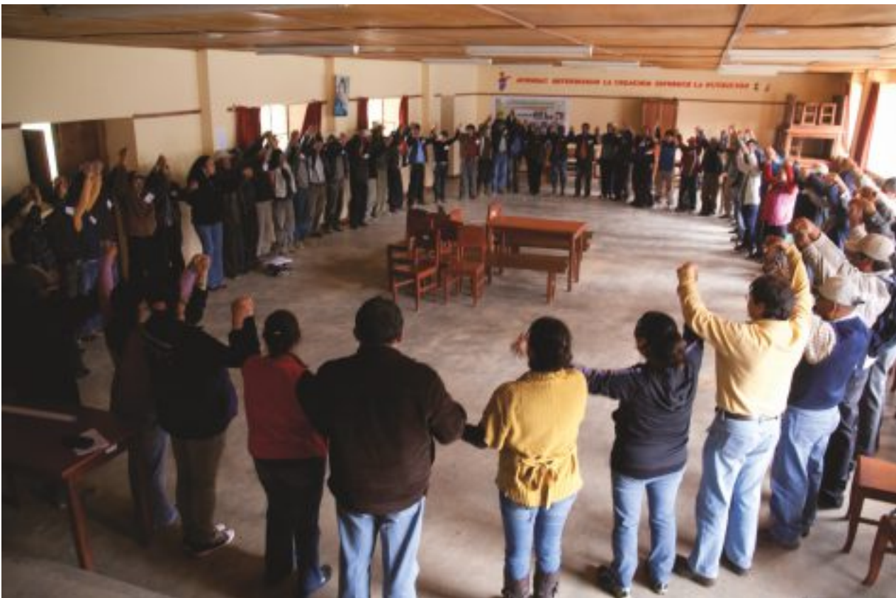
Taller de la Alianza por el Desarrollo y contra la Pobreza, participaron los socios de la Alianza y los CODECOS de los caseños del ámbito Conga.