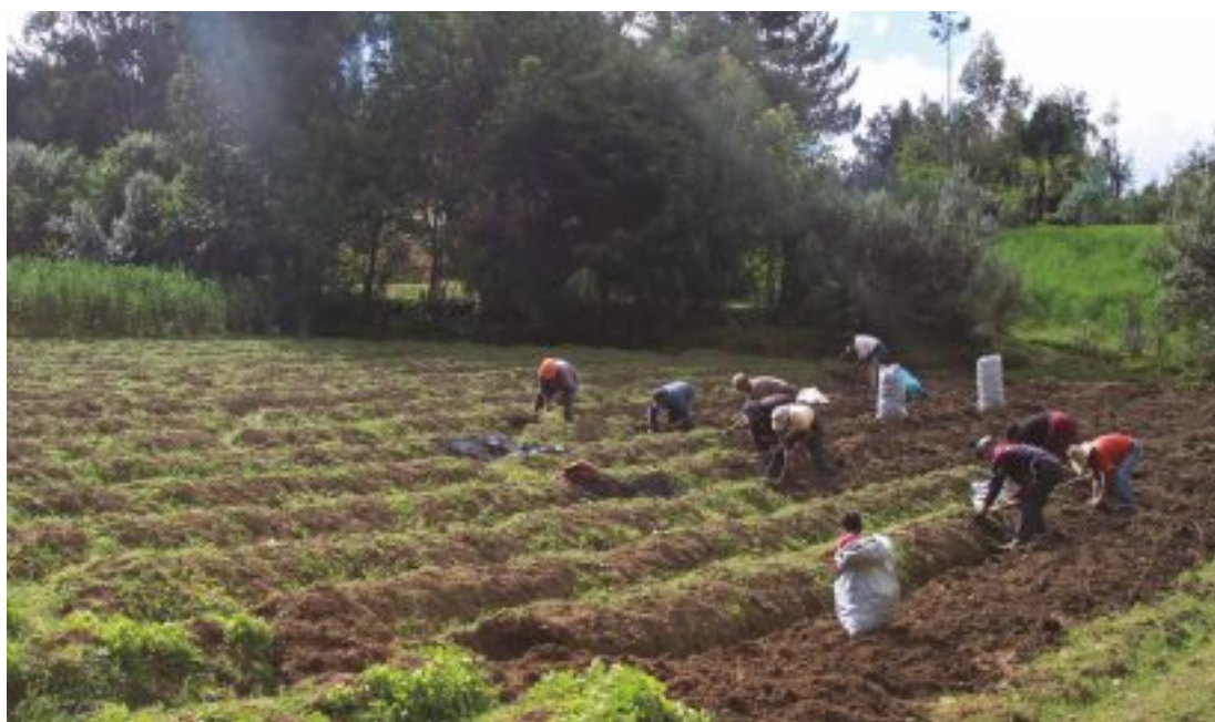
Campos agrícolas con cultivo de papa, en plena cosecha.

Hay que tener en cuenta la declinante tendencia de la agricultura al crecimiento y la persistencia de la pobreza en los hogares agrícolas como tendencias mundiales: “La pobreza del mundo está concentrada en la agricultura y en la zona rural” 23 .