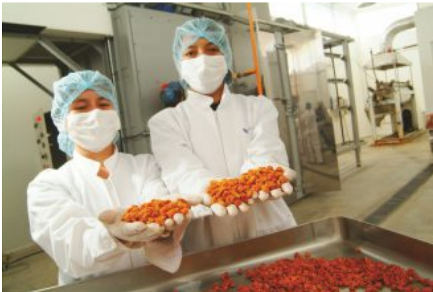
Fruta Nativa: Aguaymanto - Planta de deshidratado con fines de exportación.

Es una enorme oportunidad la que se conjuga en esta área de Cajamarca al concentrarse recursos económicos y medios sociales para la agricultura y la ganadería con la formación de nuevos empleos vinculados a la minería.