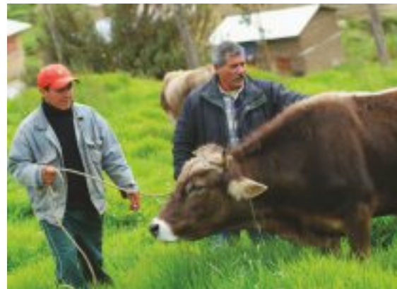
Proyecto Ganadero con asistencia técnica.