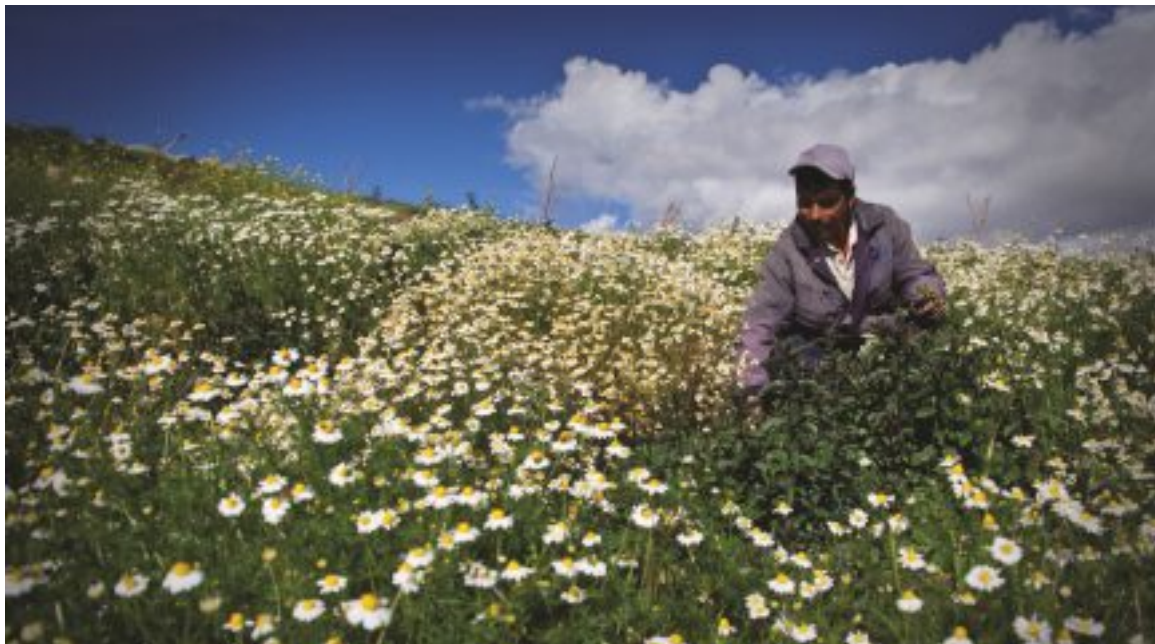
Hierbas aromáticas – Cultivo de Manzanilla.

El gran desafío es mejorar en América Latina la gobernabilidad en la agricultura y las zonas rurales.