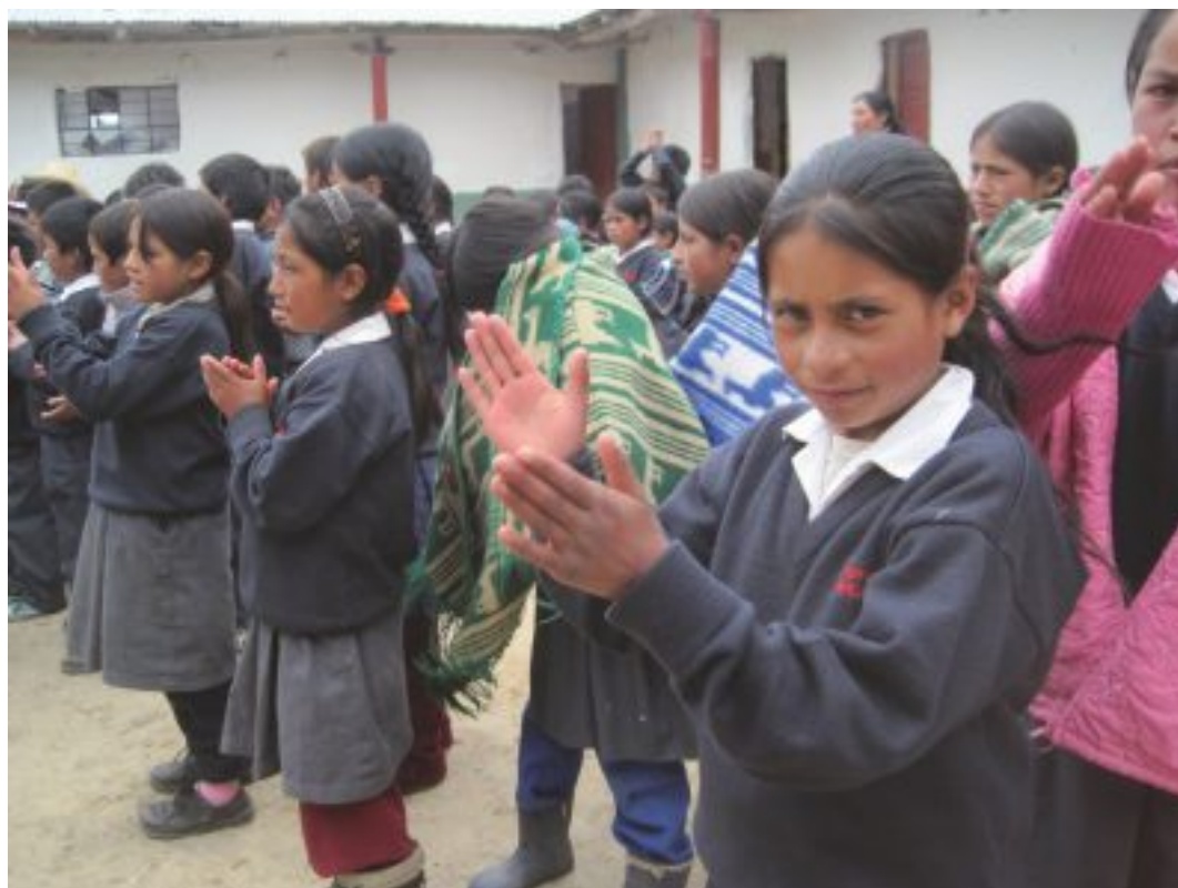
Niñas estudiantes del Colegio El Lirio de Santa Rosa de Huasmín.