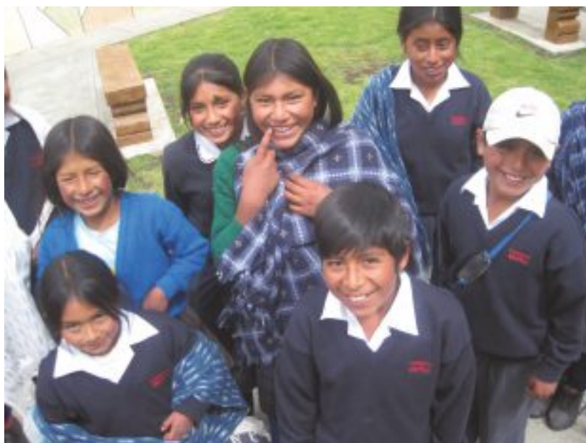
Estudiantes del nivel primario de Porcón Alto de la Red Educativa Cajamarca 1.

Las dimensiones del desarrollo son: el ser, el tener, el hacer y el estar; y las nueve necesidades humanas fundamentales son: subsistencia, protección, afecto, entendimiento, participación, ocio, creación, identidad y libertad.