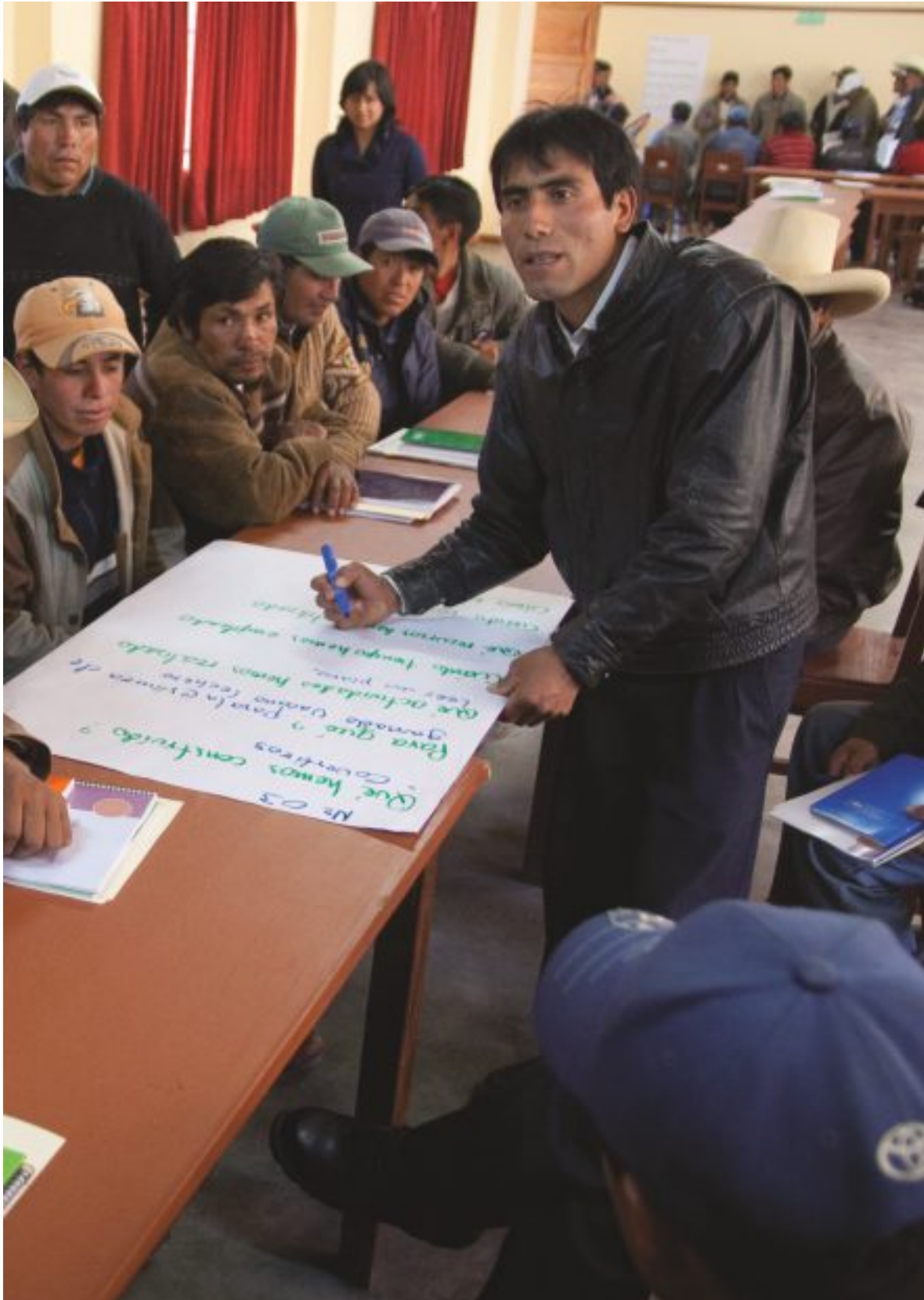
Presidente del Comité de Desarrollo Comunal de Faro Bajo en el Taller de Elaboración de Perfiles de Proyectos Comunales en Celendín.