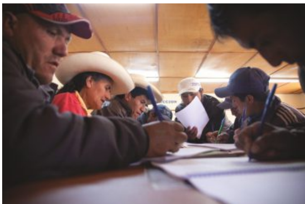
CODECOS - Taller de elaboración de perfiles de proyectos comunales en Celendín.

“Es un proceso participativo que permite a las personas, familias y colectivos del territorio mejorar sus condiciones de vida de manera sostenible, fortalecer sus capacidades y pasar de la subsistencia a una articulación equilibrada con el mercado. Estas mejoras en las condiciones de vida se lograrán mediante el aprovechamiento responsable de sus recursos y potencialidades, el empoderamiento y gestión transparente de los programas sociales que impulsados desde la Alianza público - privada - comunal, se articulen con la oferta estatal en el marco de los planes de desarrollo concertado. Siempre respetando la identidad cultural, promoviendo la asociatividad, la competitividad, la innovación tecnológica y el fortalecimiento institucional.” 26