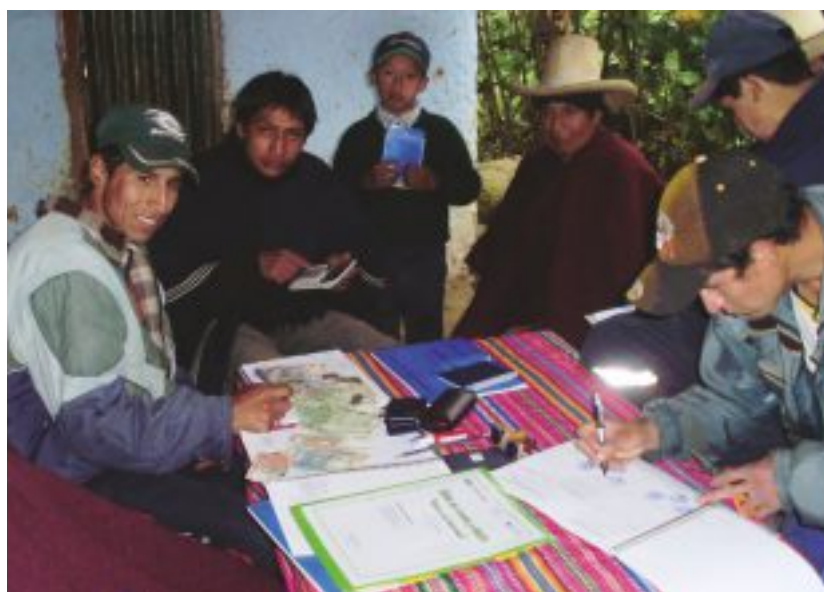
Uniones de Crédito y Ahorro del caserío El Tingo – Sorochuco.

De manera general, la historia del desarrollo rural peruano da cuenta de distintas visiones. El Informe sobre el Desarrollo Mundial (2000-2001) bajo una definición multidimensional de pobreza plantea una estrategia de desarrollo basada en tres pilares fundamentales hacia los cuales deben orientarse las estrategias de nuestro país y otros que buscan un desarrollo rural sustentable y sostenido: