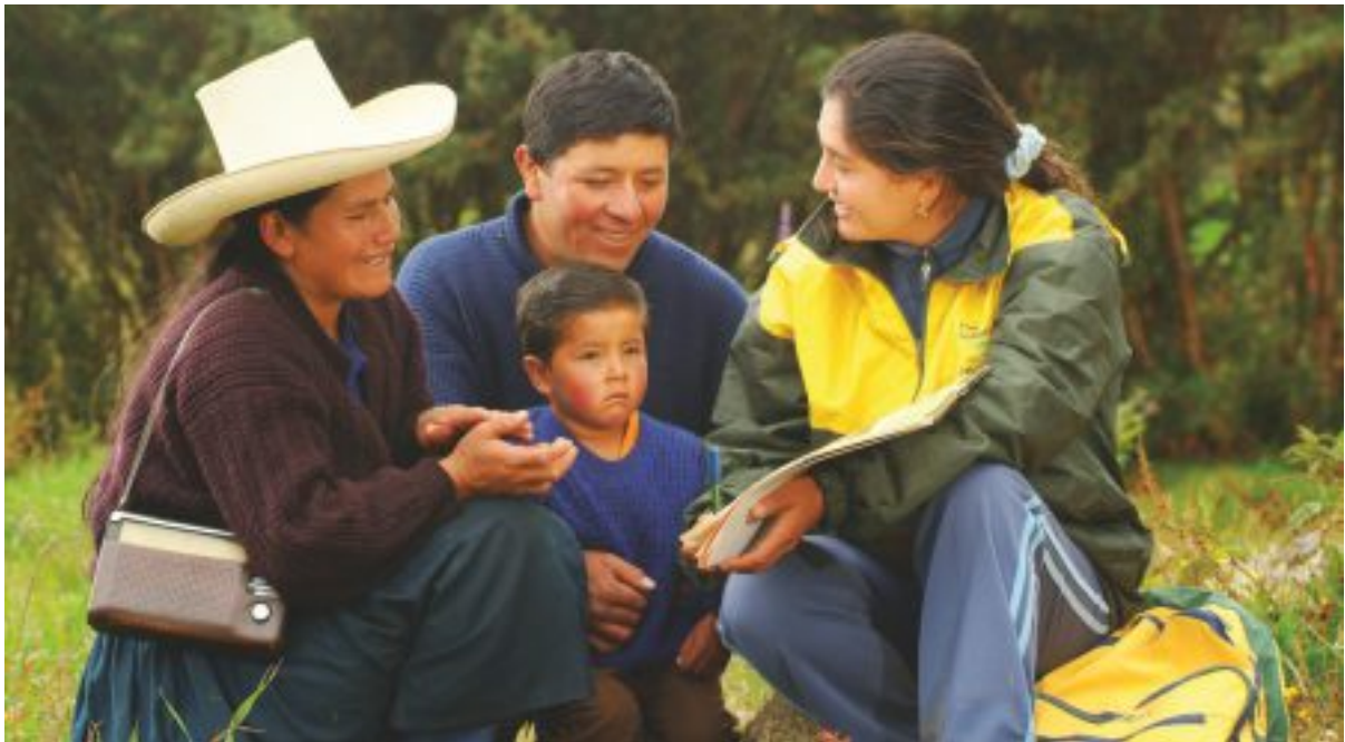
Familia de Santa Rosa de Huasmín en consejería por parte de facilitadora de PREDECI.

Aunque no existe una definición exacta del enfoque de MVS, este puede describirse como: