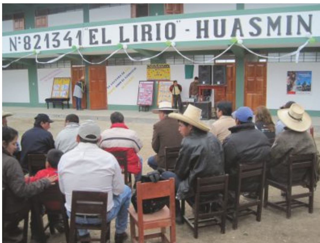
Inauguración del Colegio El Lirio - Santa Rosa de Huasmín.