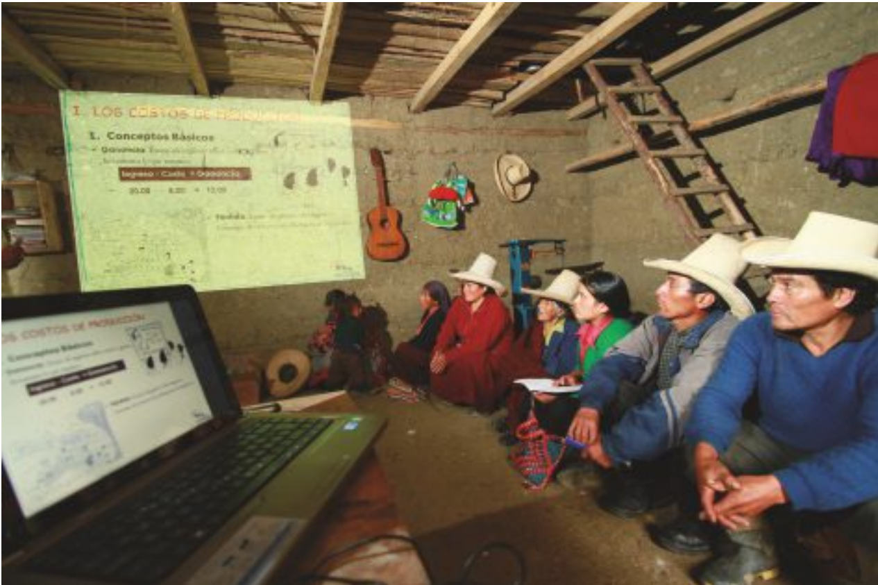
Comunidad organizada Faro Bajo - Sorochuco.

Nadie tiene la solución mágica para los problemas sociales de un país, ni para los problemas propios de las poblaciones rurales. No existe una fórmula única.